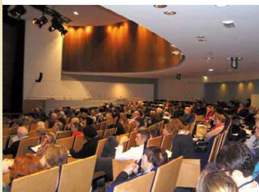
Ministère des affaires Sociales, de la Santé et du Droit des femmes

Cent cinquante personnes environ ont assisté à cette session de sensibilisation. Après un discours du président de la FNAF qui a beaucoup travaillé avec la fédération des orthophonistes pour que cette réunion ait lieu au ministère, différents spécialistes de l'aphasie sont intervenus : neurologue, médecin de médecine physique et de réadaptation, orthophoniste, psychologue. Dans l'ensemble et à des degrés divers ces interventions étaient trop difficiles pour les aidants que nous sommes. ❖