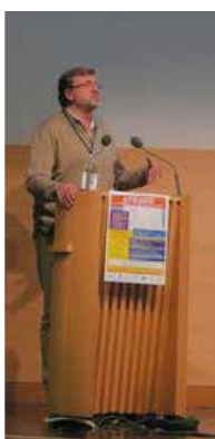
Pr Serge Bakchine, neurologue