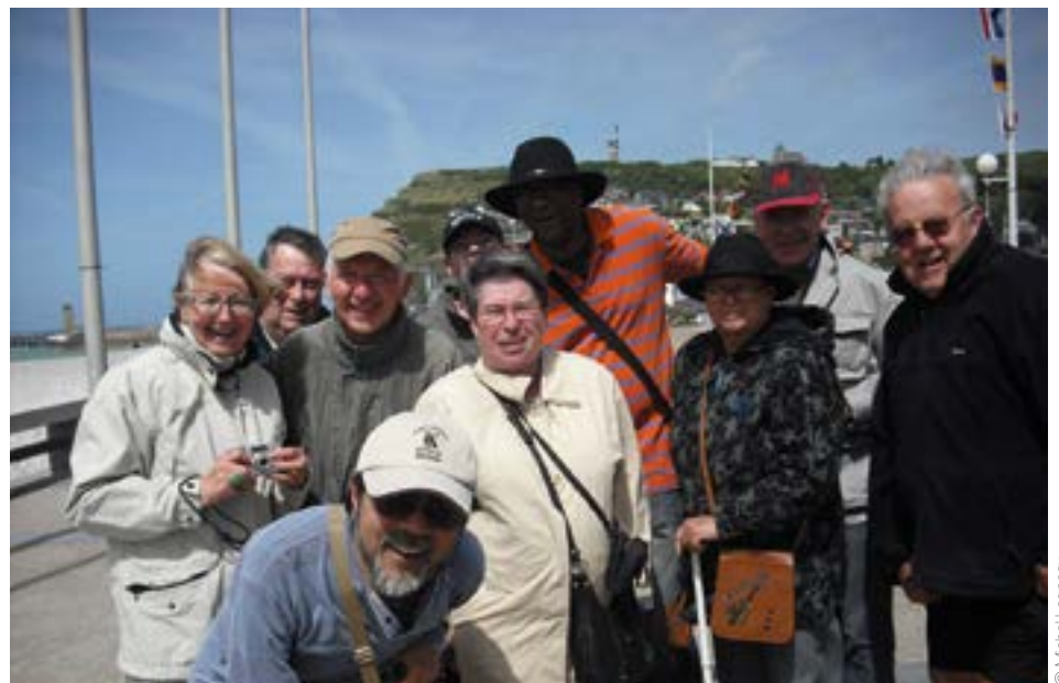
Le groupe d'aphasiques en vacances à Riville