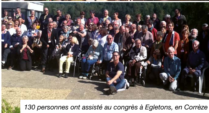
130 personnes ont assisté au congrès à Egletons, en Corrèze

VISITEZ LE SITE DU GAIF www.aphasie-idf.fr